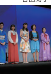
第2部のNHK東京児童合唱団