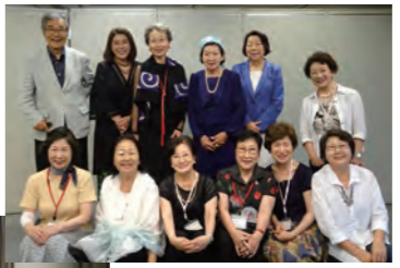
103回(写真上)、102回(写真下)の様子