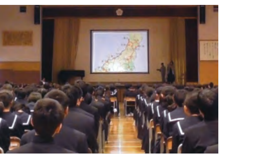
江戸川区立小松川第二中学校の体育館にて