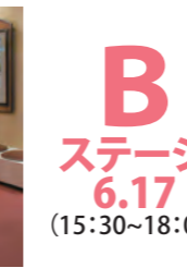
B ステージ 6.17 (15:30~18:00)