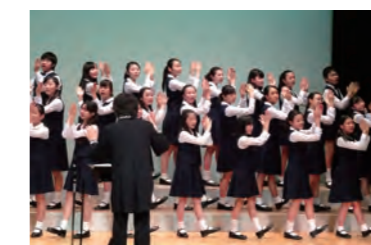
第2部のNHK東京児童合唱団