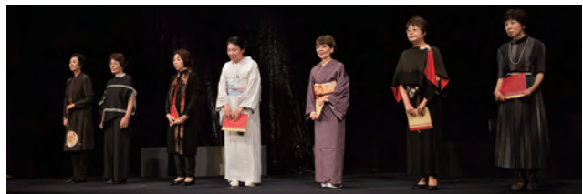
『平家物語の女性達』④