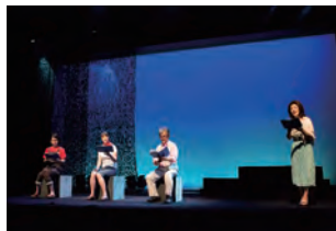
『花もて語れ』より「やまなし」