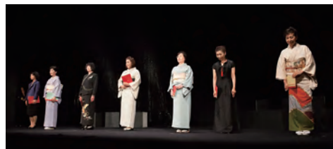
『平家物語の女性達』③