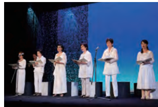
オリオン「金子みすゞの世界」