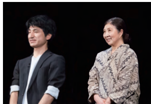
「被災地の聞き書き 101」