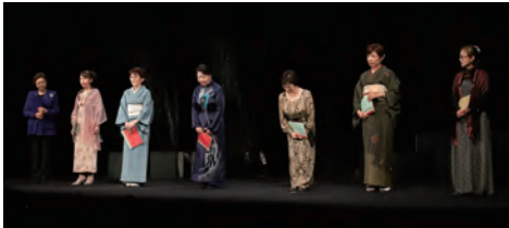
『平家物語の女性達』②