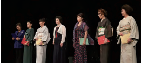
『平家物語の女性達』①