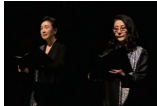
アダムスシスターズ「文字禍」