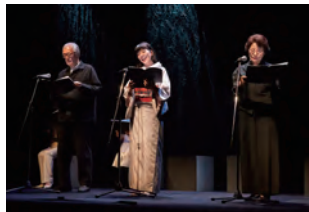
六華仙「小説智恵子抄」