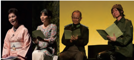
『花もて語れ』より「野ばら」