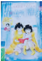
『花もて語れ』より「ごん狐」