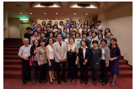
全ステージ無事終了