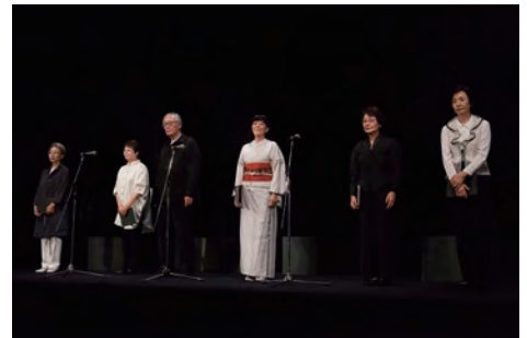
六華仙「小説智恵子抄」