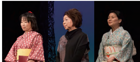
『花もて語れ』より「花さき山」