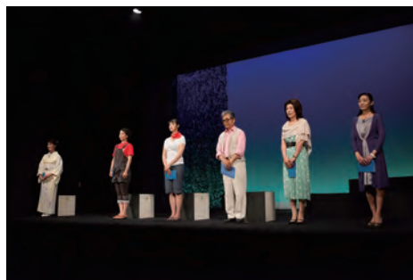
『花もて語れ』より「やまなし」